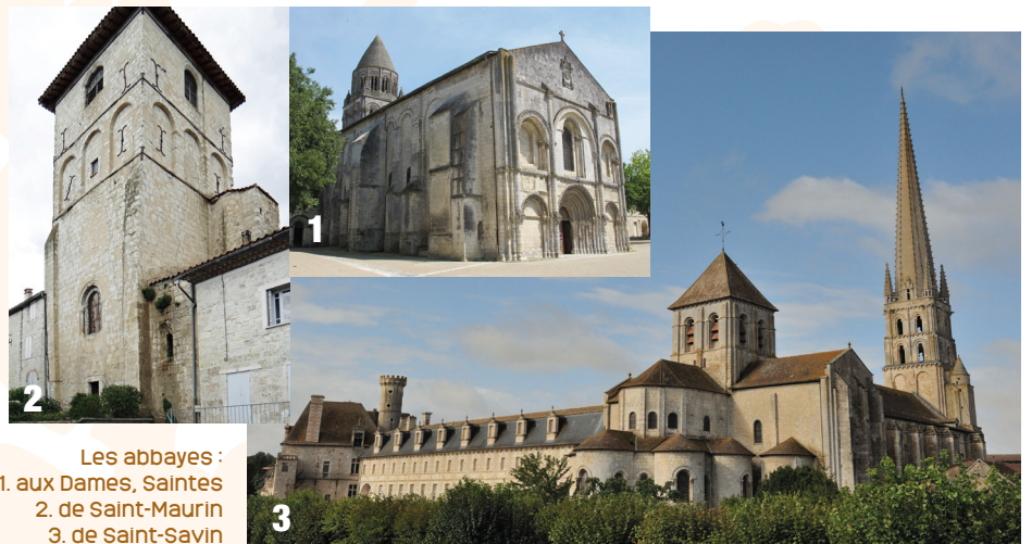
Les abbayes : 1. aux Dames, Saintes 2. de Saint-Maurin 3. de Saint-Savin